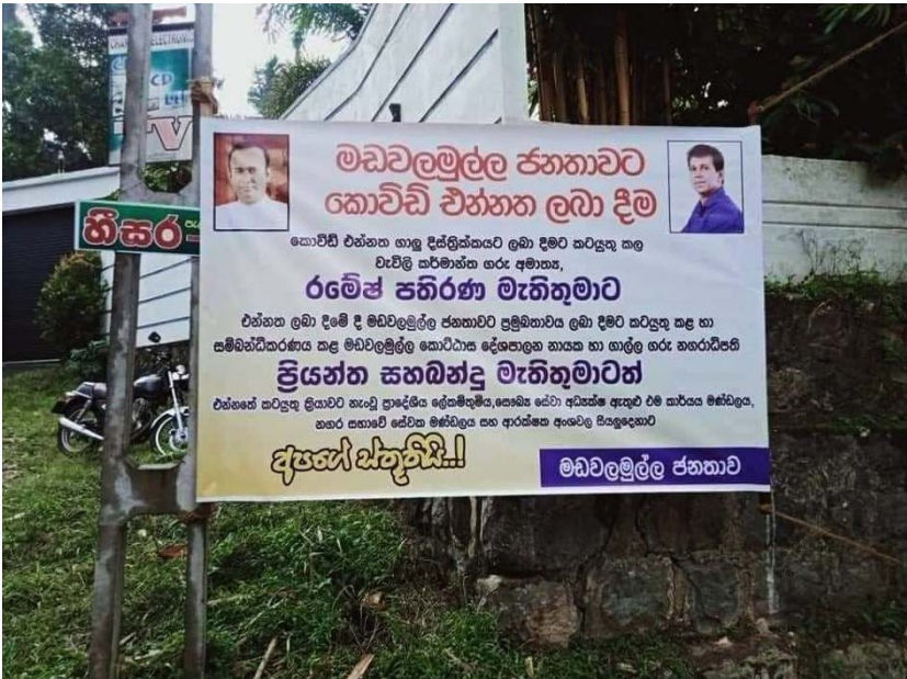
ඡායාරූපය 1: එන්නත් කිරීමේ වැඩසටහන ගාල්ල දිස්ත්‍රික්කයේ මඩවලමුල්ලට ගෙන ඒම වෙනුවෙන් වැවිලි අමාත්‍ය රමේෂ් පතිරණාට සහ ගාල්ල නගර සභාවේ නගරාධිපති ප්‍රියන්ත සහබන්දුට ප්‍රදේශවාසීන් ස්තූති කරති.