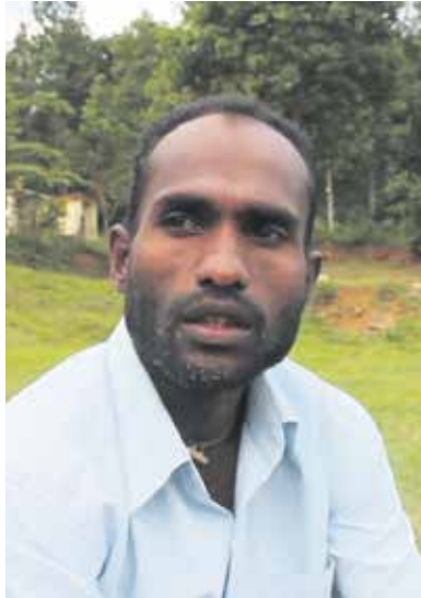
පොලීසියෙන් ඇවිත් විමසුවා මොකක් ද වුණේ කියා අසන විට මගේ හිතට වදයක්.

මහිමාරන් කියලා තව කෙනෙකුත් ඉන්නවා. ඉතිං එයාගේ ගෙදර කට්ටිය පොලීසියට පැමිණිල්ලක් දාලා තිබුණා. ඒ අවස්ථාවේ පොලීසියෙන් මහිමාරන්ව සොයාගෙන ආවා. මගේ නමත් මහිමාරන් නිසා මාවත් සොයාගෙන ආවා. එසේ වන විට බොහෝ දෙනෙකුගෙන් මහිමාරන් කවුදැයි විමසනවා. මේ විදියට කේ. මහිමාරන්ව සොයනවා. ඔහුගේ පවුලේ ප්‍රශ්නයක් නිසා අපට පැමිණිල්ලක් ලැබී ඇතැයි කියා මහිමාරන්ව සොයා වන විට, මම කන්දේ වැඩ කරමින් සිටියා. එවිට කන්දට පොලීසිය වනවිට මගදී දෙනුත් දෙනෙකුගෙන්ම විමසා තිබෙනවා. පසුව වැඩපොළේ සියලුදෙනාම මාගෙන් විමසා සිටියා. ඔබව සොයා ආවේ පවුලේ ප්‍රශ්නයක් දැයි ද විමසුවා. ඒකට මම නැහැ කීවා. පසුව සොයා බලද්දී වෙනත් මහිමාරන් කෙනෙක් සිටිය බව දැනගන්නට ලැබුණා. මේ විදියට බොහෝ අවස්ථාවලදී මාව සොයාගෙන ඇවිත් තිබෙනවා. මාව පොලීසියට කිසිම දවසක රැගෙන ගිය නැහැ. නමුත් ගමේ සොයන කොට මට අවනම්බුවක් ඇති වෙනවා. මා ගැන බොහෝ දෙනෙක් විමසන විට, පාසැලේ ගුරුවරුන්ගෙන් විමසන විට, ඔවුන් පවුලේ ප්‍රශ්නයක් ද මොකක්ද ගැටලුව,