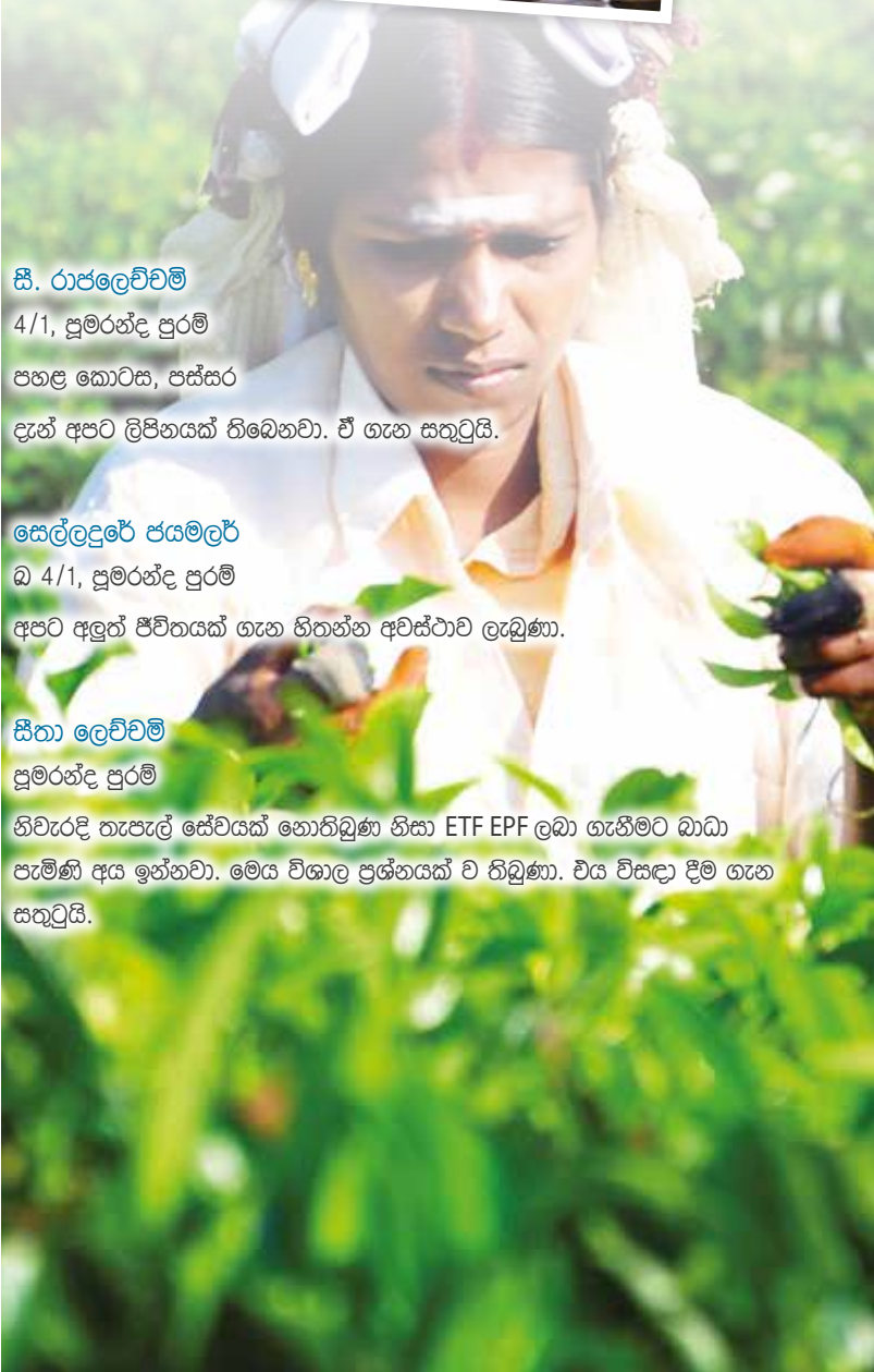
සීතා ලෙච්චම් පුමරන්ද පුරම් නිවැරදි තැපැල් සේවයක් නොතිබුණ නිසා ETF EPF ලබා ගැනීමට බාධා පැමිණි අය ඉන්නවා. මෙය විශාල ප්‍රශ්නයක් ව තිබුණා. එය විසඳා දීම ගැන සතුටුයි.