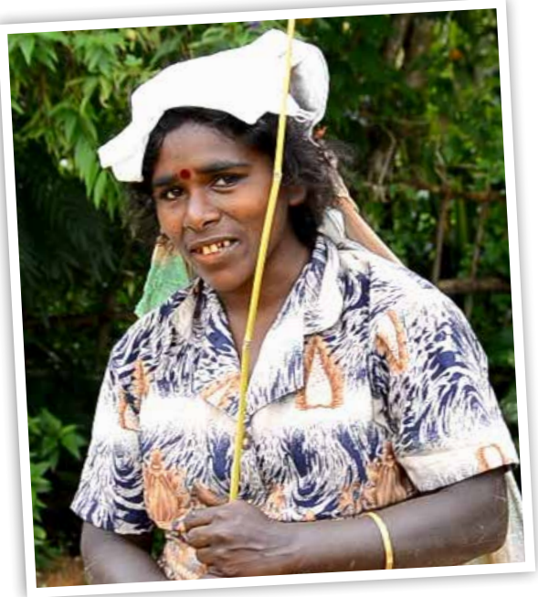
සී. රාජලෙච්චම් 4/1, පුමරන්ද පුරම් පහළ කොටස, පස්සර දැන් අපට ලිපිනයක් තිබෙනවා. ඒ ගැන සතුටුයි.