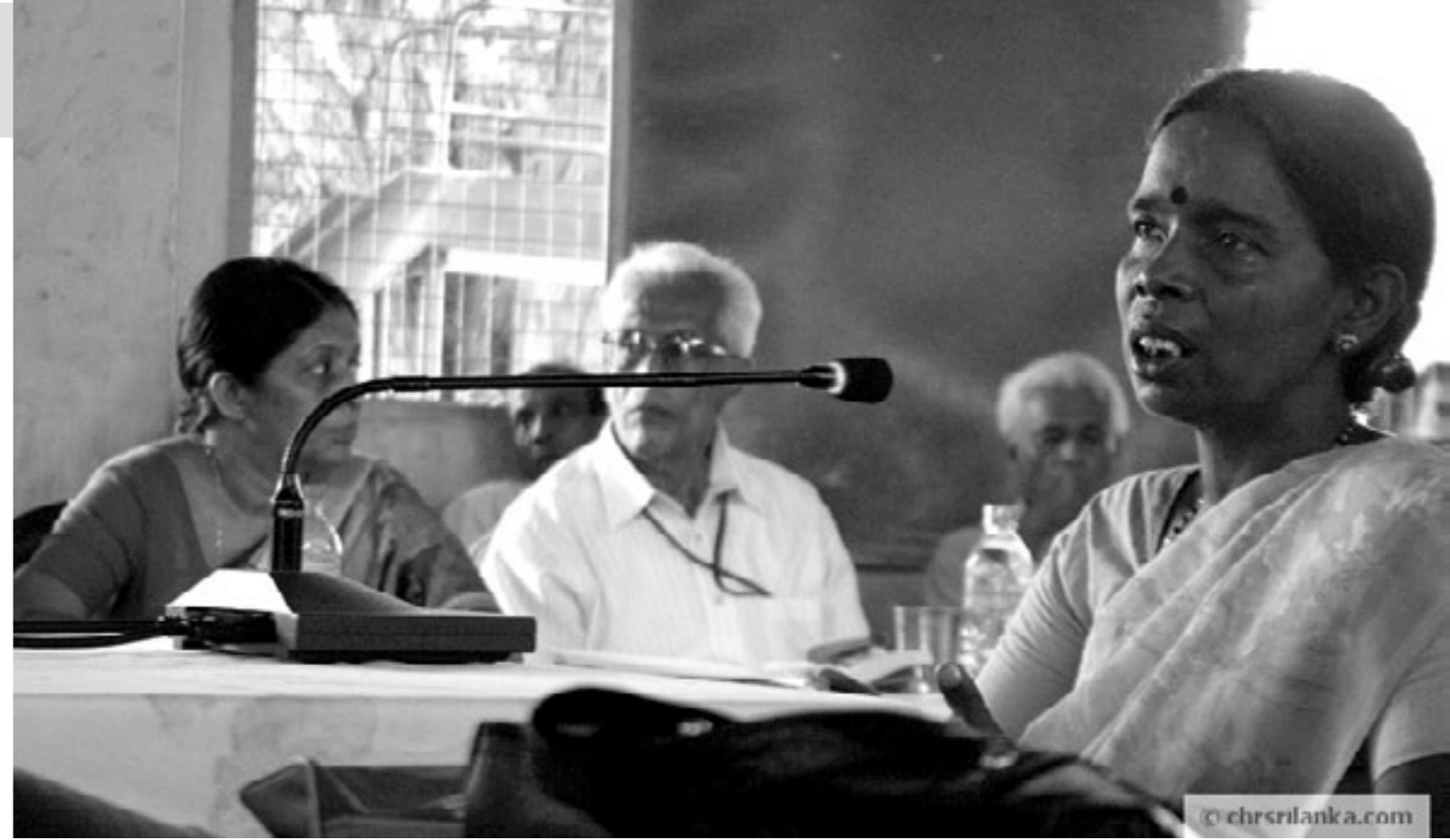
மன்னாரில் LLRC ஆணைக்குழு சாட்சிகளைப் பதிவு செய்கிறது.

“சில பரிந்துரைகள் பாராளுமன்றத்தின் விசேடத் தெரிவுக்குழுக்கள் மூலமும், சில பரிந்துரைகள் அவற்றிற்கே உரித்தான நிறுவனங்கள் மூலமும் செயற்படுத்தப்பட வேண்டும். அதே சமயம் மேதகு ஜனாதிபதியினதும், ஜனாதிபதிச் செயலாளரினதும் கண்காணிப்பின் கீழ் ஜனாதிபதிச் செயலகத்தால் அமுல்படுத்த வேண்டிய பரிந்துரைகளும் உண்டு”