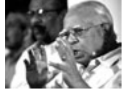
அரசியலமைப்புக்கான திருத்தங்களும் LLRC

ஆணைக்குழுவின் பரிந்துரைகளும் அரசியல் அமைப்புக்கான சீரமைப்புக்களை மேற்படி LLRC ஆணைக்குழுவின் பரிந்துரைகளின் போது தமிழர் தேசியக் கூட்டமைப்பு முன்வைத்த கருத்துக்களையே ஆணைக்குழுவும் வலியுறுத்தியுள்ளது. இவ்வறிக்கையை "மிகத் தெளிவற்ற அனேகமாக அரசியல் அலங்கார வார்த்தைகள்" அங்கு குறிப்பிடப்பட்டுள்ளன. இரண்டு காரணிகளை அடிப்படையாகக் கொண்டு இதைப் புரிந்துகொள்ள வேண்டும்.