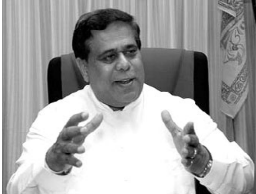
சபை முதல்வரும் அமைச்சருமான திரு. நிமல் சிரிபால டி சில்வா