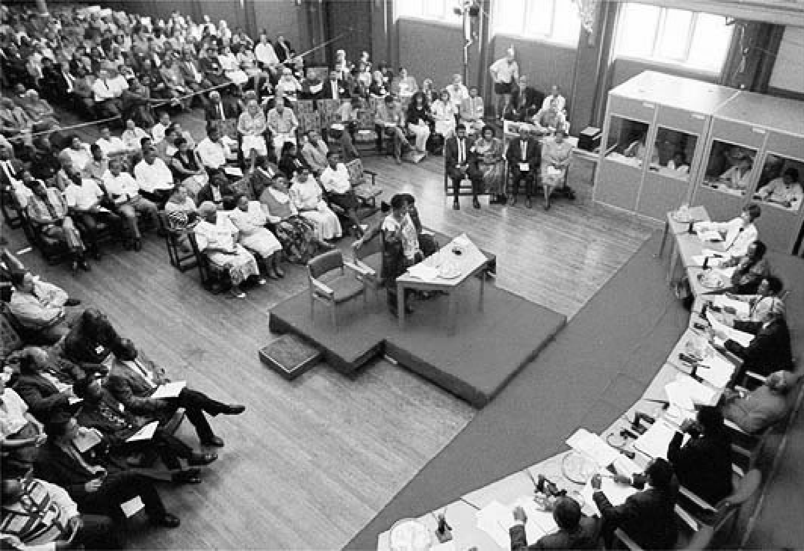
உண்மையைக் கண்டறிதும் ஆணைக்குழு கூடிய சந்தர்ப்பம் : தென் ஆபிரிக்கா