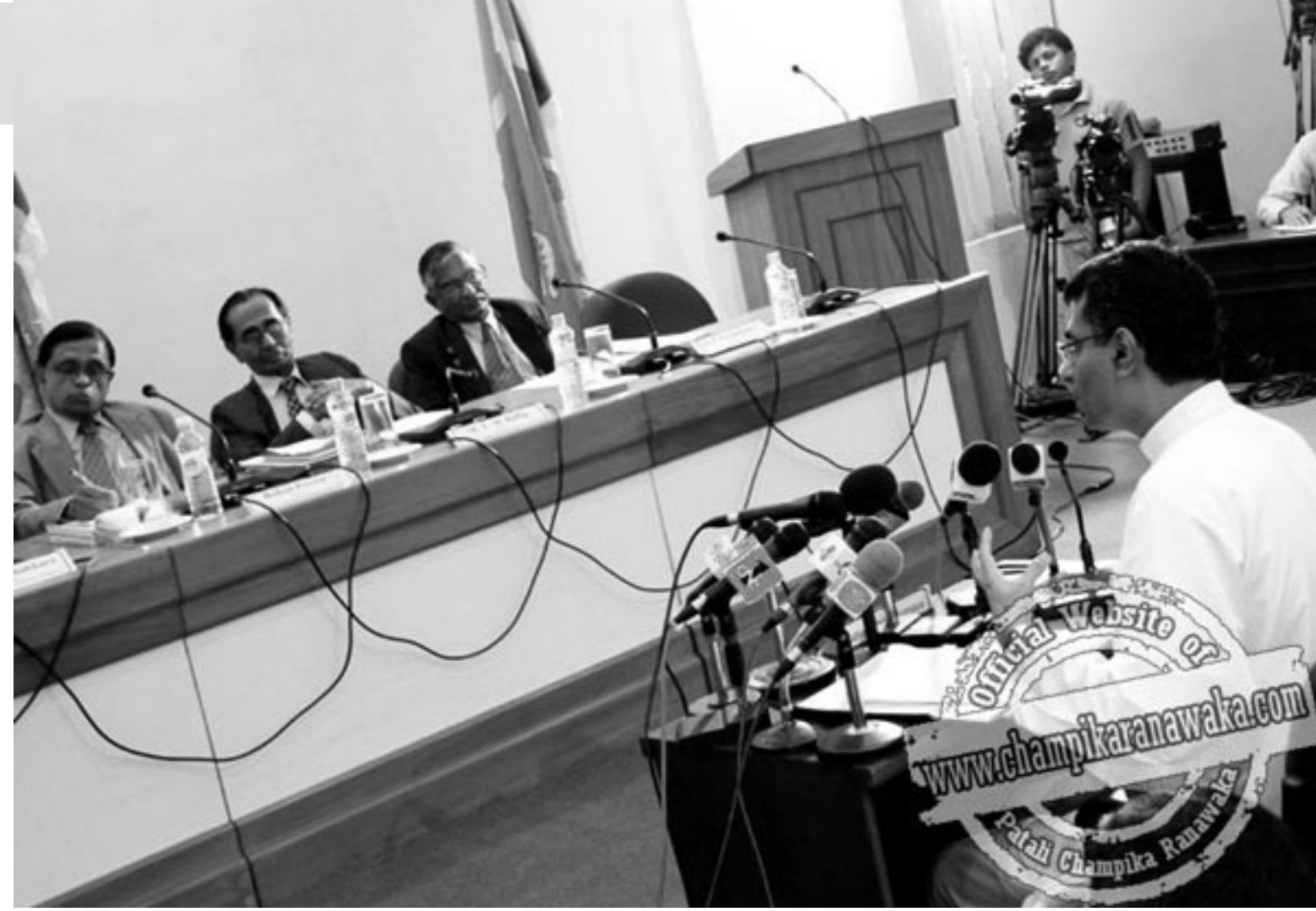
மின்சக்தி துறை அமைச்சர் சம்பிக்க ரணவக்க ஆணைக்குழு முன் சாட்சியம் அளிக்கையில்

நடவடிக்கைத்திட்டத்தின் பரிந்துரைகளைப் பற்றி அவசியமான நடவடிக்கைகளை மேற்கொள்ள அரச நிறுவனங்களிடம் ஒப்படைத்து மூன்று மாதம் முதல் மூன்று ஆண்டுகள் வரை கால அவகாசம் கோரப்பட்டுள்ளது. நடவடிக்கைத் திட்டம் அவ்வளவா இல்லையா என்பதை ஆராய்ந்து பார்ப்பது பொது மக்களிடம் ஒப்படைக்கப்பட்டுள்ளது. நாட்டு மக்களையும் உலக மக்களையும் ஏமாற்றாது சொல்வதைச் செய்வதாயின் அதனை போற்றுவதற்கு நாம் எப்போதும் தயாராக இருக்கிறோம்.