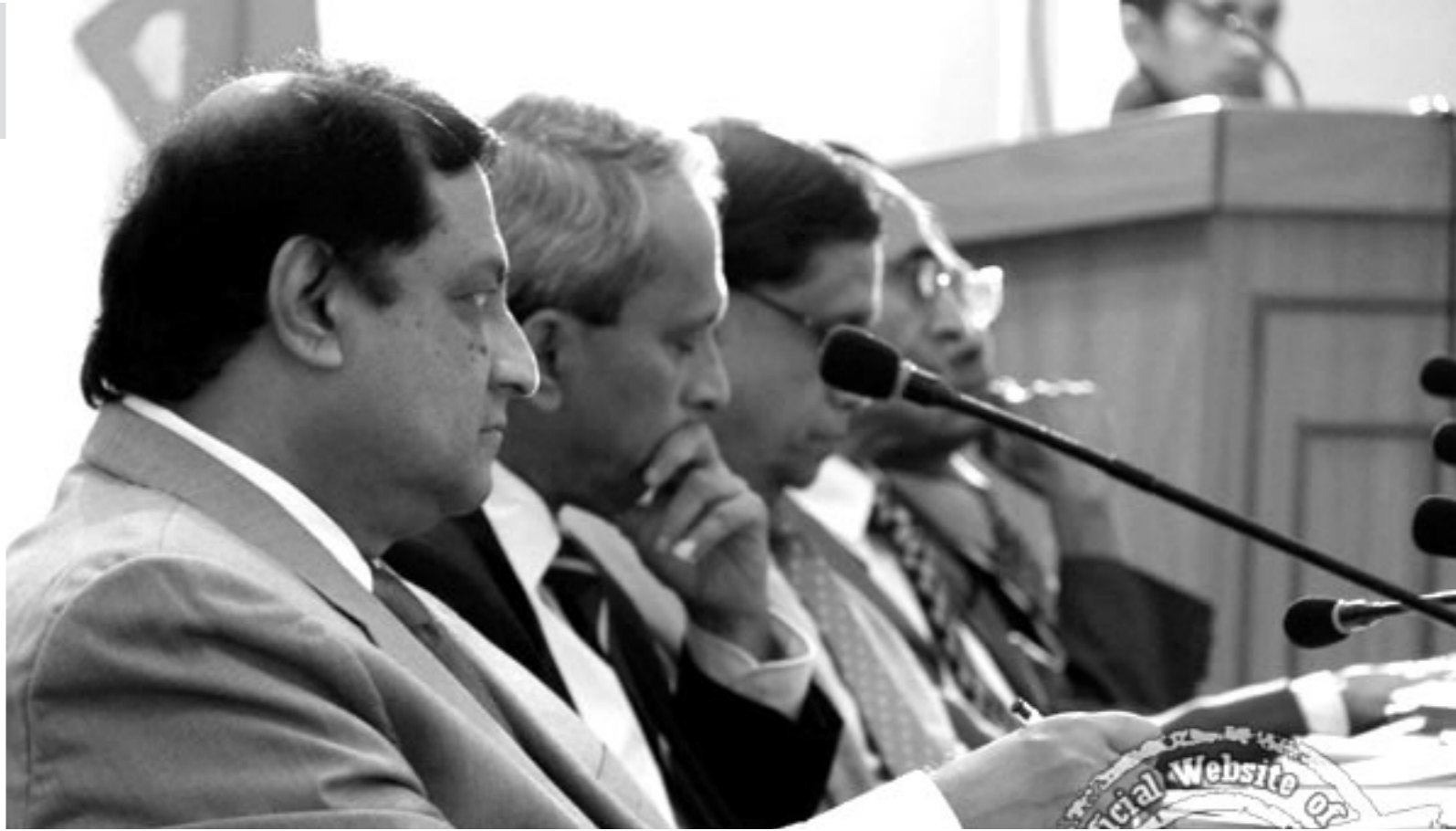
LLRC ஆணைக்குழுக்களில் ஒரு சிலர்

இலங்கை பற்றிய நல்லபிப்பிராயம் அனேகமான நாடுகளுக்குக் கிடையாது. அபகீர்த்தியான ஒரு வரலாறு எமது நாட்டிற்கு எதிராக உருவாகிக் கொண்டிருக்கிறது. அண்டை நாடான இந்தியா ஐ.நா. மனித உரிமைப் பேரவையில் வாக்களித்ததை நாம் சிறு விடயமாகக் கருத முடியாது. இத்தகைய வெளிநாட்டுச் செல்வாக்குகளிருந்து எம்மை விடுவித்துக்கொள்ள இராஜதந்திர ரீதியான நடவடிக்கைகளை ஆரம்பிக்க வேண்டும். LLRC ஆணைக்குழுவின் பரிந்துரைகளை உரிய முறையில் அமுல்படுத்துவதன் மூலமே அரசாங்கம் தனது இருப்பை உறுதி செய்ய முடியும். எவ்வாறாயினும் இலங்கைக்கு எதிரான குற்றச்சாட்டுக்கள் மீண்டும் மீண்டும் வலியுறுத்தப்படுகின்றன. தமிழ் புலம்பெயர் சமூகத்தில் நன்னோக்கு கொண்டவர்களின் உறவை மேம்படுத்தி தமிழ் மக்களின் நம்பிக்கையை உறுதிப்படுத்துவது அவசியம். அதேசமயம் தமிழ் நாட்டுடனான உறவை நாம் சீர்செய்ய வேண்டும். அவ்வாறு செய்யாவிட்டால் இந்தியாவுக்கும் இலங்கைக்கும் அச்சுறுத்தலாக தமிழ் நாடு சர்வதேச சமூகத்தின் ஒத்துழைப்பை நாட முடியும். இறுதியாக நாட்டைப் பிரிக்கும் இடத்திற்கு செல்லக்கூடிய சாத்தியம் இல்லாமல் இல்லை.