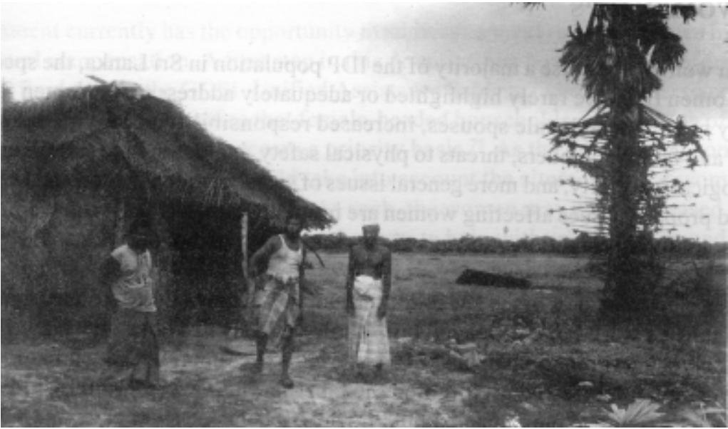
ආපසු පැමිණි මුස්ලිම්වරුන් - මුසාලි මන්තාරම් දිස්ත්‍රික්කය

‘ආර් ආර් ඒ එන්’ යෝජනා ක්‍රමය යටතේ, ඕනෑ ම පුද්ගලයෙකුට ජීවිත හා දේපළවලට කෙරෙන හානිය සම්බන්ධයෙන් වන්දි ඉල්ලා සිටිය හැකි ය. එය රු. 100,000 හෝ භානියෙන් 20% යන දෙකෙන් අඩු මුදල විය යුතු ය. බොහෝ අවතැන්වූවන් ආපසු නො ඒමටත්, හුදෙක් පවුලේ සාමාජිකයින් අතුරින් පිරිමියා පමණක් ආපසු පැරණි ඉඩකඩම වෙත ඒමටත් හේතුව මෙය බව හඳුනා ගෙන ඇත. පවුලේ සාමාජිකයින් තමන් අවතැන් වූ දිස්ත්‍රික්කවල පදිංචි වී සිට දිගින් දිගට ම වියලි ආහාර සලාකය සඳහා ලියාපදිංචි වී සිටින අවස්ථාවල එම පවුල්වලට අයත් ආපසු පැමිණෙන අනෙක් සාමාජිකයින්ට එක්සත් ජාතීන් ගේ සරණාගත කොමිසමින් සැපයෙන ආධාර ලැබීමට හිමිකමක් නො මැත.