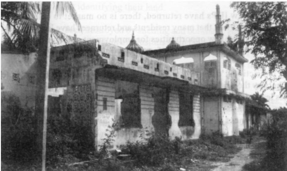
යාපනයේ, මුවර් විවීයේ විනාශයට පත් මුස්ලිම් දේවස්ථානයක්

මුස්ලිම්වරු සතුව තිබූ ආර්ථික වත්කම්, නිවාස, රූපවාහිනී සහ ගුවන්විදුලි යන්ත්‍ර, ශීතකරණ, ලීබඩු, විදුලි සහ විද්‍යුත් උපකරණ සහ වාහන කොල්ලකාගෙන ඇති නිසා හෝ විනාශ වී ඇති බැවින් ආපසු ලබාගැනීමේ හැකියාවක් නැත.