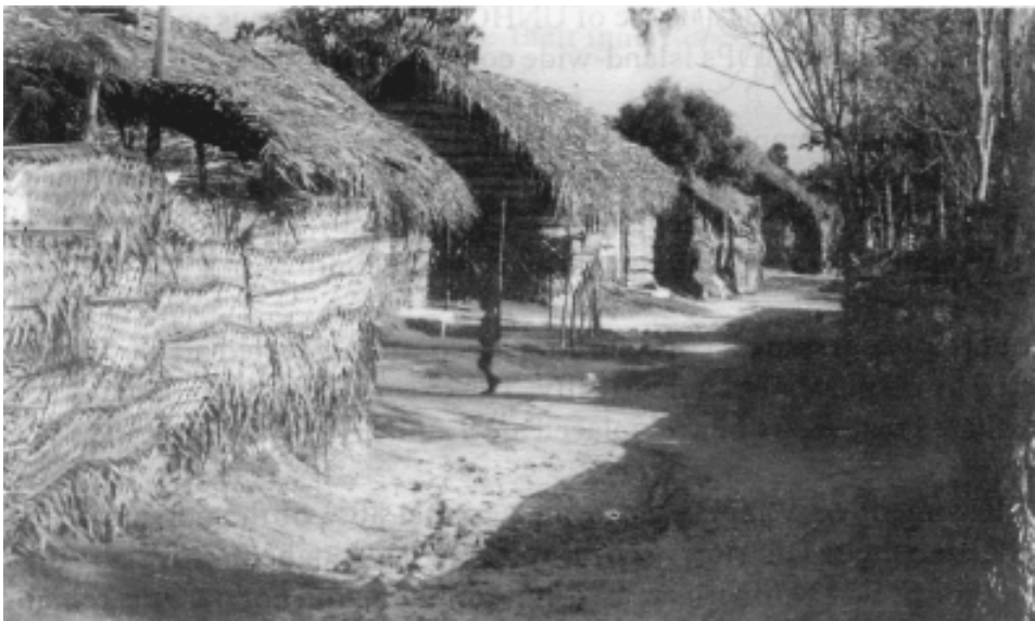
පුත්තලම සුභ සාධන මධ්‍යස්ථානය

එල්ටීටීඊ පාලනයට යටත්ව ඇති වන්නි ප්‍රදේශයේ ජනතාවගෙන් 80%ක් අවතැන් වී ඇත. කිලිනොච්චි දිස්ත්‍රික්කයේ සංඛ්‍යාලේඛන අනුව එම ප්‍රදේශයේ පමණක් 91.75% අවතැන් වී