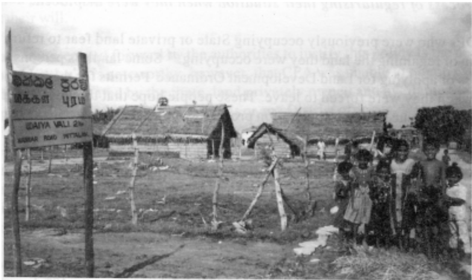
පුත්තලමේ අවතැන් වූ දරු පිරිස්

අවතැන් වූ බොහෝ පුද්ගලයින් විවාහපත් වී සිටින මුත් ඔවුන් සතු දේපළක් නො මැත. වසර 12 පුරා අවතැන් වී සිටින මුස්ලිම් ජාතිකයින් සහ 1985 සිට නැගෙනහිර පළාතේ අවතැන් වී සිටින ජනතාව මෙයට කදිම නිදර්ශණයකි. පුත්තලම් ප්‍රදේශයේ ආරම්භයේ සිට අවතැන් වූවන් ගේ සංඛ්‍යාව 14,000 ක් වුව ද, දැනට එය 17,000 දක්වා වැඩි වී ඇත. ආර්.ඩී.එෆ් සංවිධානය පවසන අයුරු පුත්තලමේ වෙසෙන නව පරපුරේ 50% කට ආපසු පැමිණීම සඳහා තමන් සතු ඉඩම් නො මැති අතර උතුරු ප්‍රදේශයේ පදිංචිය සඳහා යාමට ඔවුහු කැමැත්තක් ද නො දක්වති.