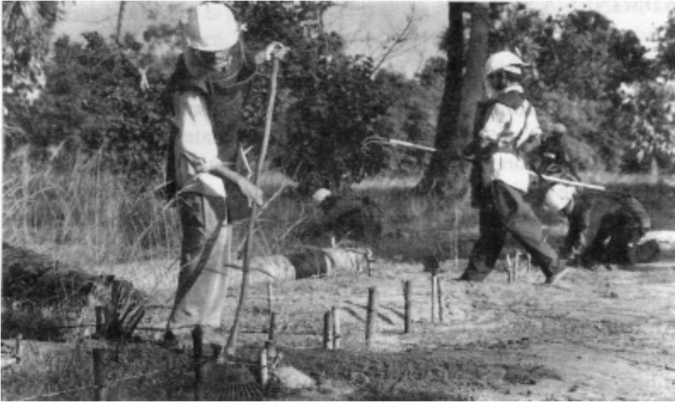
කිලිනොච්චියේ බිම් බෝම්බ ඉවත් කරන එච්චිය සාමාජිකයින් - ටීම් ඩිකින්සන්

එල්ටීටීඊ පෙදෙස්වල වලලා ඇති බිම් බෝම්බවලින් බහුතරයක් ශ්‍රී ලංකා යුධ හමුදාට අයත් ය. එල්ටීටීඊය විසින් යොදා ගනු ලබන බිම් බෝම්බ අතුරින්, ජොනී 95 බෝම්බවල බැටරිය මාස 6-12 අතර කාලයක් සක්‍රීයව පවතී. ජලය නිසා බිම් බෝම්බ අඩපණ වේ. කෙසේ වුවද, මෙම බිම් බෝම්බ නිශ්කාන්තය නොකළහොත් සිවිල් ජනතාවට මහත් තර්ජනයක් වනු ඇත.