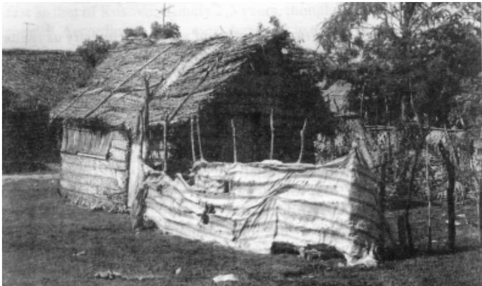
මන්තාරමේ නැවත පදිංචි කරන ලද ගමක්

ඇතැම් අවස්ථාවල රජයේ බලපත් ලබා ඇති පුද්ගලයින් (6:3 බලන්න) තම ඉඩම් කොටස් කර අවතැන් වූවන් වෙත ඔවුන් යළි පදිංචි කරවීම සඳහා විකුණා තිබේ. එහෙත් රජයෙන් දෙන ලද ඉඩම් විකිණීම නීති විරෝධී වේ. 1995 දී රාජ්‍ය අනුග්‍රහයෙන් මෙහෙයවන ලද වැඩසටහනක කොටසක් වශයෙන් අවතැන් වූ පිරිස් යළි පදිංචි කරවන ලද ඉඩම්වලින් 60% ක් ම නීති විරෝධී ලෙස ලබා ගන්නා ලද රජය සතු ඉඩම් බව හෙළි වී ඇත. (නීති විරෝධීව අත් සතු කරන ලද ඉඩම් පිළිබඳ 5:4 බලන්න.) දේශපාලන පක්ෂ සහ හමුදා සහායක කණ්ඩායම් විසින් වෙනත් අයට අයත් ඉඩම්වල පිහිටි ජනපද 8 ක ඉඩම් නො මැති අවතැන් වූ පුද්ගලයින් පදිංචිකර ඇත. නිවාස 100 යෝජනා ක්‍රමයේ කොටසක් වශයෙන් දේවස්ථාන ඉඩම්වල යළි පදිංචි කරවා ඇති මන්තාරම් දිස්ත්‍රික්කයේ අවතැන් වූ පිරිස් අවිනිශ්චිත අනාගතයකට මුහුණපා සිටිති. සමහර අවතැන් වූවන් රජය සහ රාජ්‍ය නො වන සංවිධාන විසින් වවිනියා ප්‍රදේශයේ නොයෙක් තැන්වල යළි පදිංචිකර තිබේ. නැවත පදිංචි කිරීමේ ගම් බොහොමයක් හුදෙක් තාවකාලික වැඩපිළිවලක කොටසක් සේ පෙනී යන අතර පදිංචි කරුවන්ට කිසිදු ලේඛනයක් මෙතෙක් ලබා දී නො මැත.