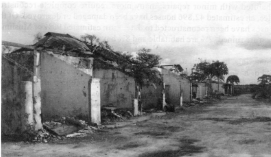
යාපහ අර්ධද්වීපයේ වාහකවීචේරියේ හානියට පත් දේපල

සටන් වැදීම, කොල්ලකෑම් සහ නො සලකාහැරීම් නිසා දේපල සහ යටිතල පහසුකම්වලට සිදු වූ හානිය සහ සාම ක්‍රියාවලියේ අවිනිශ්චිත භාවය අවතැන්වූවන් යළි පදිංචි කිරීමේ දී ඇති වන ප්‍රධාන දුෂ්කරතා වශයෙන් හඳුනා ගෙන තිබේ.