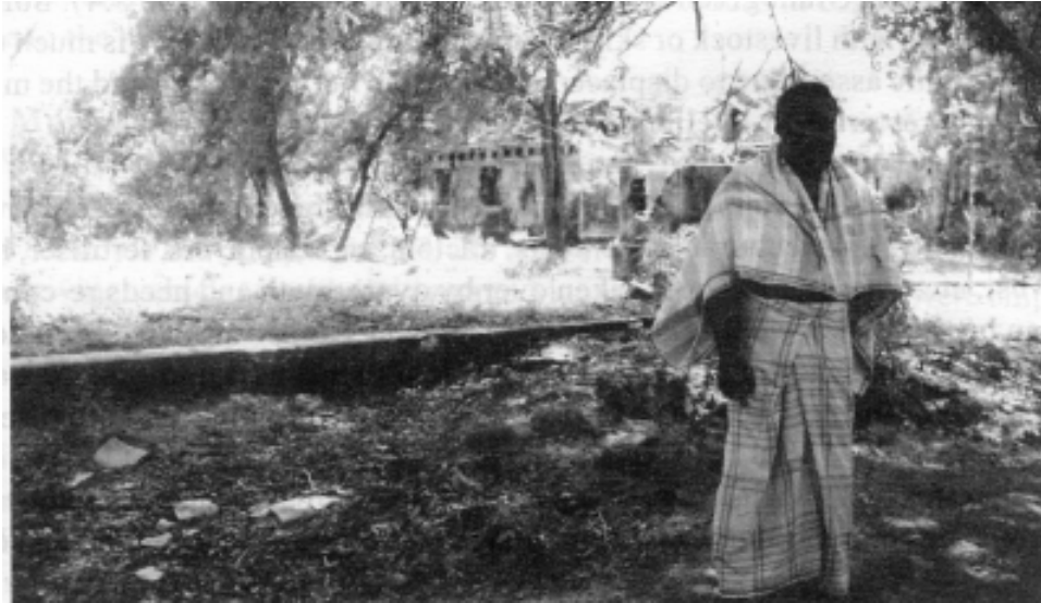
මන්නාරමේ, මුස්ලිම් ප්‍රදේශයේ ආපසු පදිංචිය සඳහා පැමිණි මුස්ලිම් ජාතිකයකු විනාශ වූ තම නිවස නිධු ස්ථානයේ සිටින අයුරු