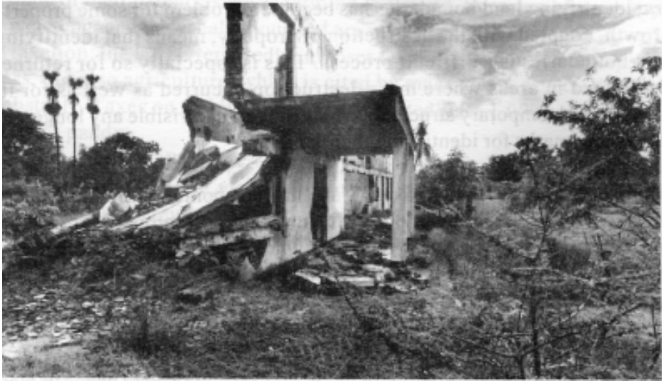
පල්ලායි දුම්රියපල - ටීම් නිකිත්සන්

අවතැන්වූවන්ට මුහුණ පෑමට සිදුවන විවිධ දුෂ්කරතා වළක්වාලීම සඳහා යටිතල පහසුකම් යළි ගොඩනැගීම සහ පුනරුත්ථාපනය කිරීම සැලසුම් කිරීමේ දී අවතැන් වූ පිරිස්වල සහභාගිත්වය අවශ්‍ය වේ. යටිතල පහසුකම් හානියට පත් නොවී ඇති අවස්ථාවල දී වුව ද, පිරිස් බලය සහ සම්පත් උගුණතාව නිසා සේවා සැපයීමට බාධා සිදු වේ.